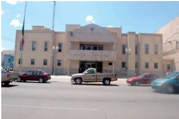
PALACIO MUNICIPAL DE CUAUHTÉMOC