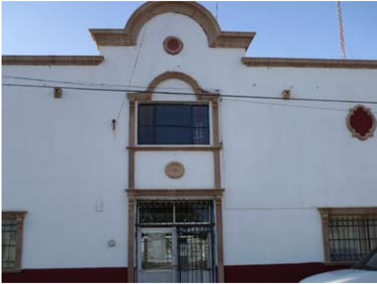
PALACIO MUNICIPAL DE MATACHÍ